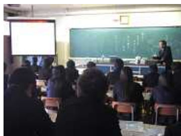
サッカーボール分子 C 60