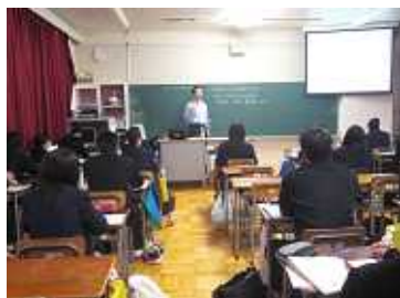
環境変化に対する細胞の応答

「総合的な学習の時間」の一環として、理型の生徒を対象に3つのテーマを設け、大学の先生方に講義をしていただきました。生徒たちは希望のテーマを選択して、講義に出席しました。