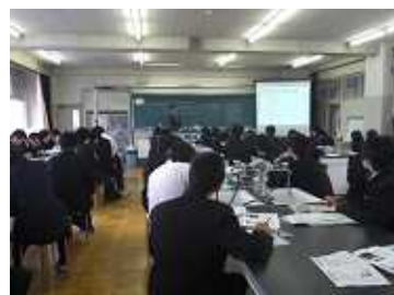
燃える氷-メタンハイドレート-